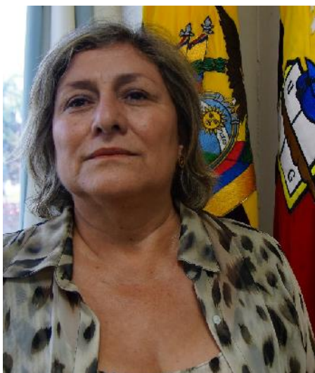
VICERRECTORA DE INVESTIGACIÓN, GESTIÓN DEL CONOCIMIENTO Y POSGRADO