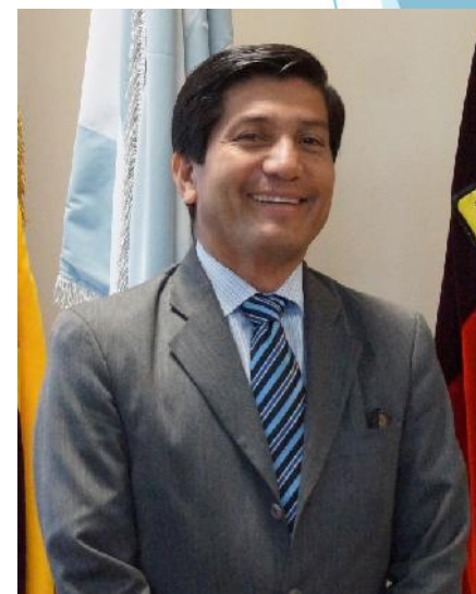
VICERRECTOR DE BIENESTAR ESTUDIANTIL