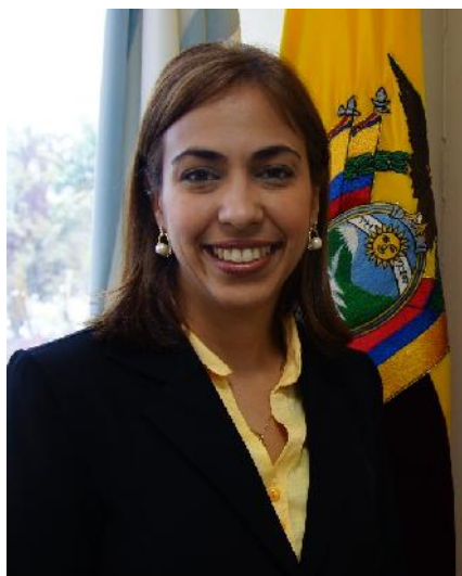
VICERRECTORA DE INTERNACIONALIZACIÓN Y MOVILIDAD ACADÉMICA